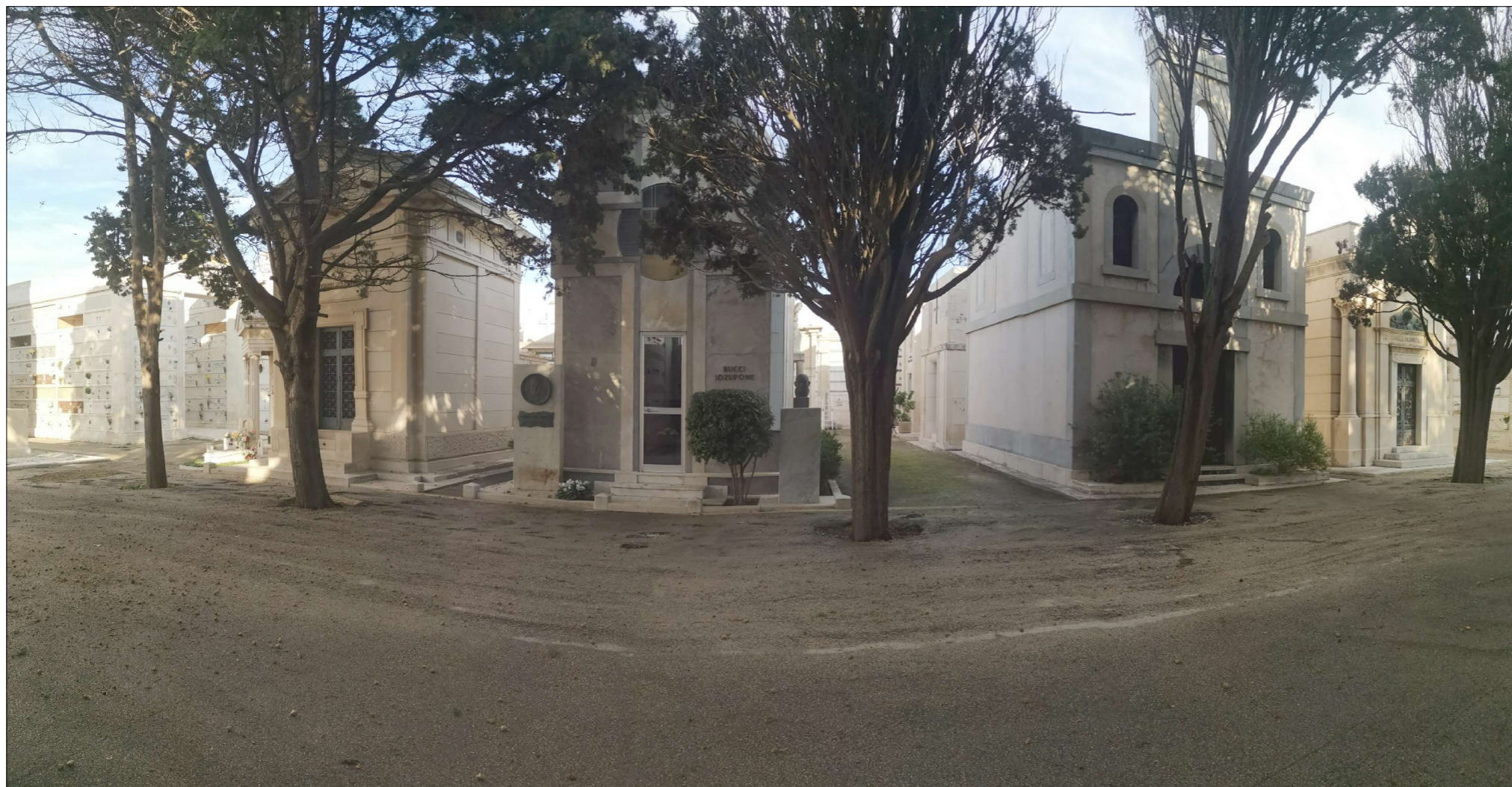
Foto 8- PANORAMICA