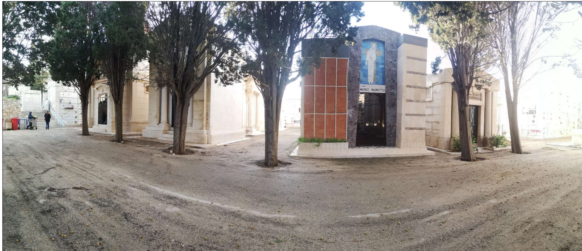
Foto 7- PANORAMICA